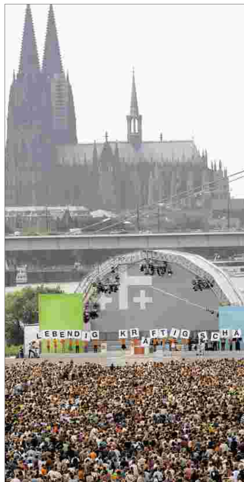
„Lebendig und kräftig und schärfer“: Unser Bild zeigt den Eröffnungsgottesdienst des 31. Deutschen Evangelischen Kirchentags am 6. Juni 2007 in Köln. Religion und Glaube spielen für die Deutschen eine wesentlich größere Rolle als allgemein angenommen.

BERLIN. Die Erfolgsmeldungen vom Ausbildungsmarkt reißen nicht ab: deutlich mehr als 600 000 abgeschlossene Verträge bis Ende September, so die jüngste Lehrstellen-Bilanz. Der Aufschwung, sagen Experten, komme nun endlich auch auf dem Ausbildungsmarkt an. Doch trotz des Ausbildungsabbaus zwischen Politik und Wirtschaft stieg die Zahl der „Unversorgten“ weiter an. Mehr als die Hälfte der Jugendlichen, die sich im laufenden Aus-